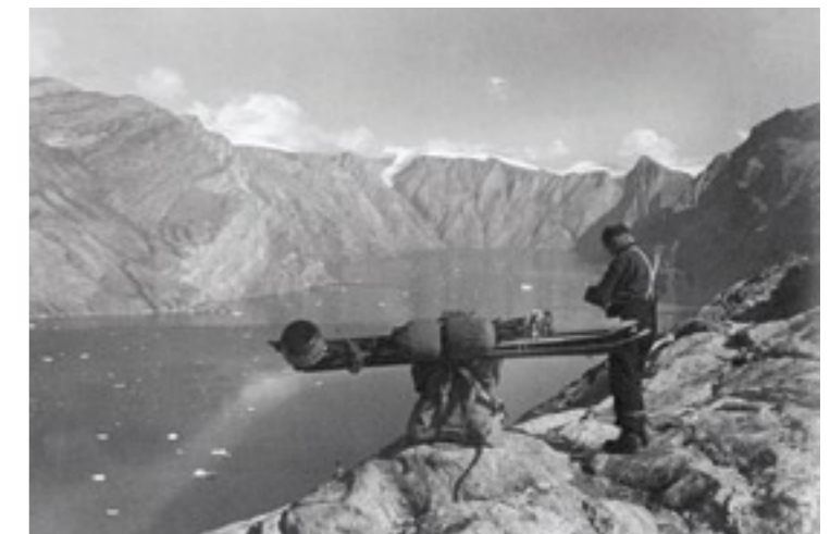
! Mit schwerer Last über dem Fjord Scoresby Sound in Grönland

«Wäre ich in Tibet entdeckt worden, würde ich heute kaum hier sitzen», sagt Gansser über siebzig Jahre später in seinem Tessiner Zuhause. Dem Forscher hätte die Todesstrafe gedroht. Damals ahnt niemand, dass ihm während des langen Fussmarsches eine Sensation gelingen sollte: Am Fuss des Kailas entdeckt er Steine, die im Lauf der Geschichte offenbar aus der Tiefe um mehrere tausend Meter angehoben worden sind. Wie sich später herausstellt, hat Gansser die Nahtstelle zwischen dem Subkontinent Indien und dem übrigen Asien entdeckt. →