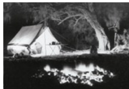
| Nachtlager am Fluss Geh, Belutschistan