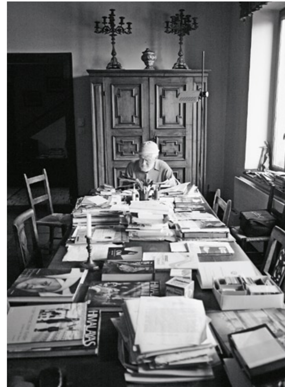
| Der 98-Jährige heute am Esstisch seines Hauses oberhalb Lugano, das zum Archiv geworden ist