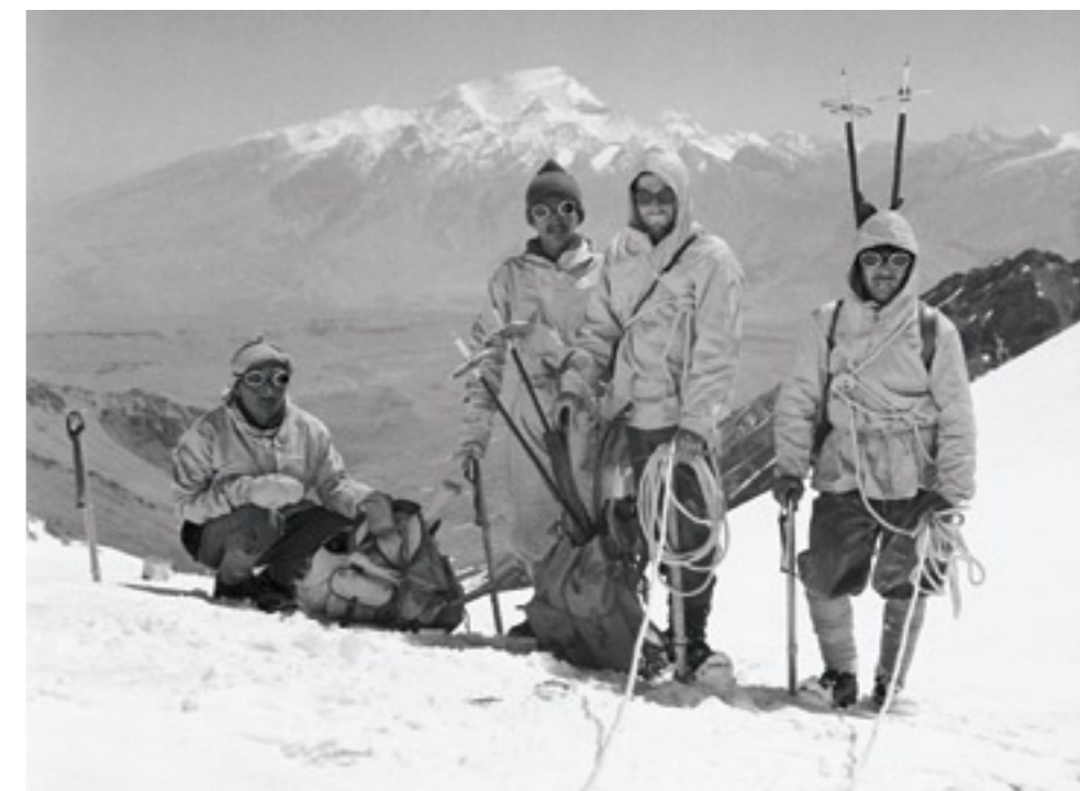
Auf Skis unterwegs im Himalaja: vor der Abfahrt vom Sabu-Sattel, 5600 Meter über Meer