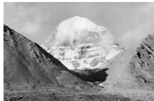
«Aus dem Meer der Gipfel erhebt sich ein weisser Kegel, ein Berg von seltener Form – es ist der Kailas, das Heiligtum der asiatischen Religionen. Meine Begleiter stehen still; bis zur Hüfte im Neuschnee rufen sie ihre Gebete in den Wind.»