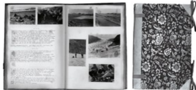
Eines von Dutzenden Tagebüchern, in denen Gansser Notizen, Zeichnungen und Fotos von seinen Reisen festhält.