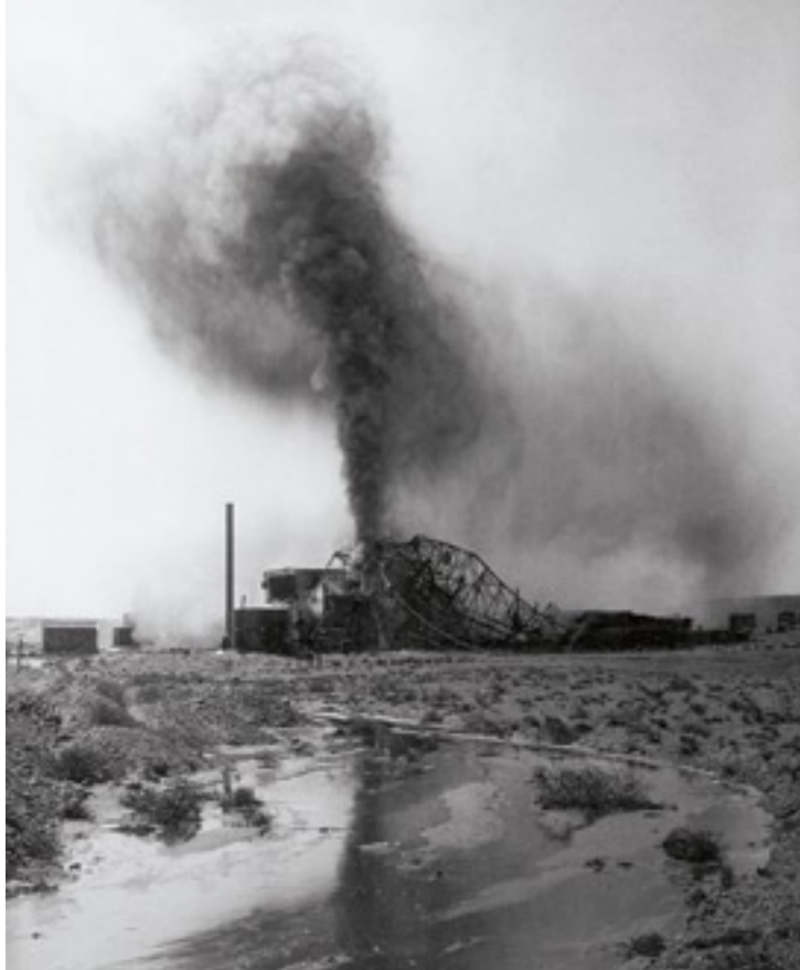
| Ausbruch einer Ölbohrung im Iran, 1956