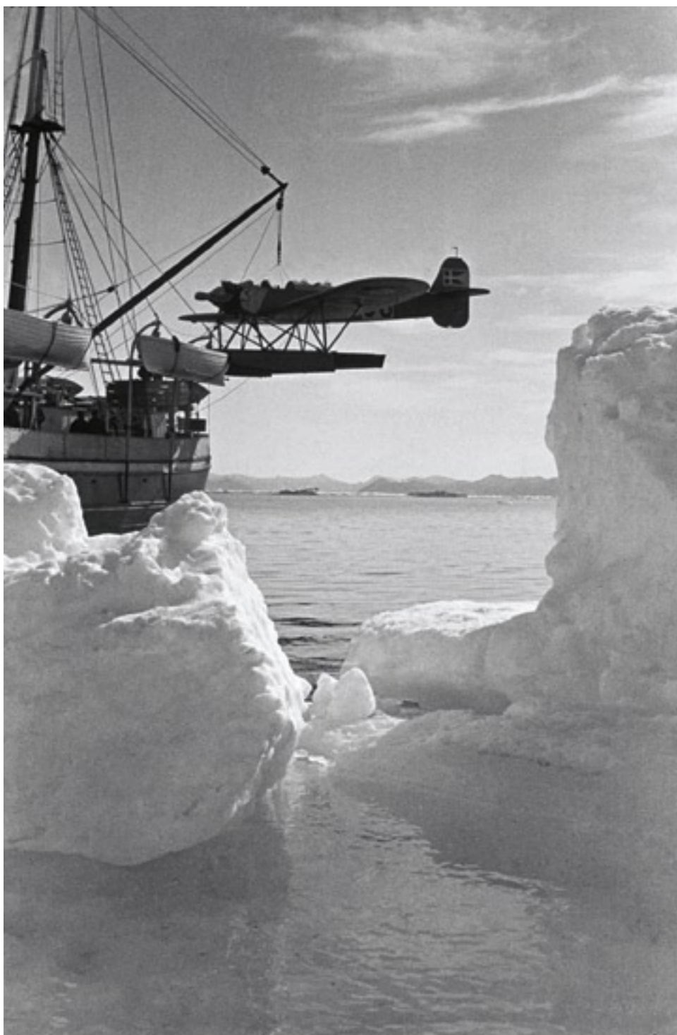
Aus Ganssers Grönland-Tagebuch: «Mit Gepolter und Gedröhn gehts weiter, das Eis knistert wie spritzende Spiegeleier in Butter.» Forschungsschiff Gustave Holmes im Polarmeer, mit Flugzeug im Huckepack