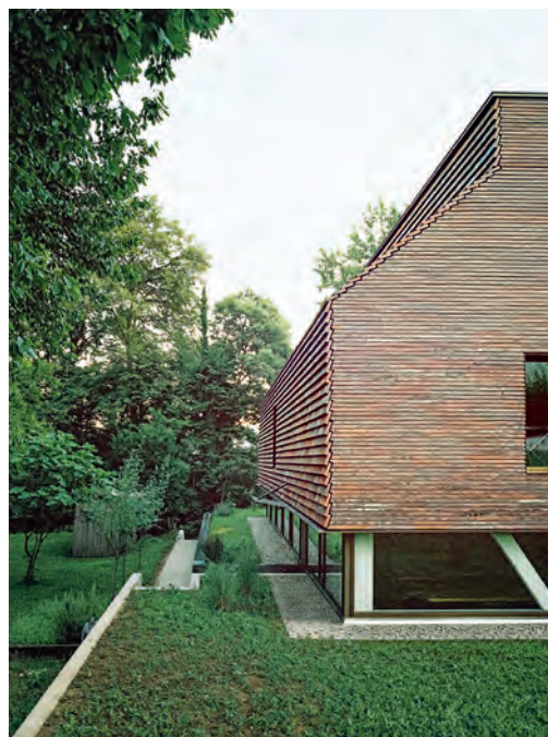
Halb eingegraben sitzt das Atelier auf dem Grundstück.