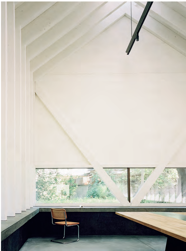
Dunkler Sockel, heller Raum: Kräftige Holzträger gliedern den Bau in Rancate.