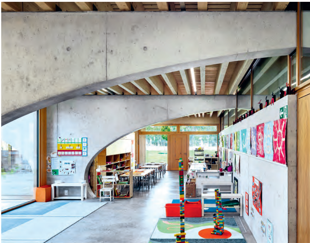
Die hölzernen Dachträger des Kindergartens in Morbio Inferiore ruhen auf zwei Reihen geschwungener Betonträger.

Via Stefano Franscini 25, Morbio Inferiore TI Bauherrschaft: Gemeinde Morbio Inferiore Architektur: Jachen Könz, Lugano Bauingenieure: Fürst Laffranchi, Grono (Beton); Pirmin Jung, Rain (Holz) Holzbau: Xilema, Bedano Gesamtkosten (BKP 1-9): Fr. 6,65 Mio.