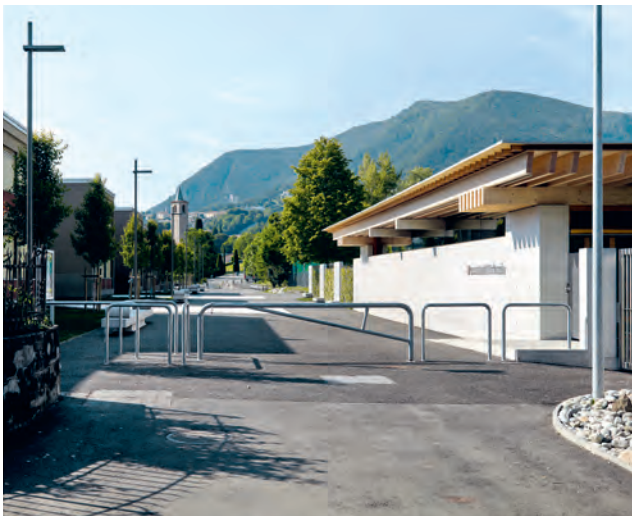
Die Strasse zwischen dem neuen Kindergarten und der bestehenden Primarschule wurde zum lang gezogenen Platz.